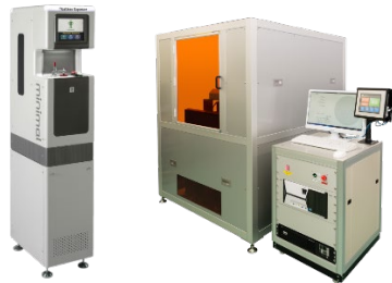
マスクレス露光装置